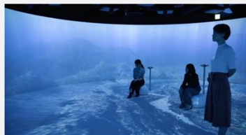
長谷工ミュージアム360°シアター (企画演出)