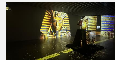
角川武蔵野ミュージアム ツタンカーメンの青春展