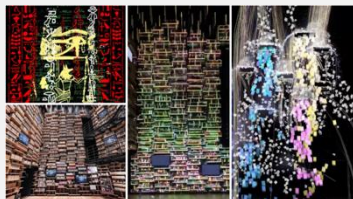
角川武蔵野ミュージアム 本棚劇場プロジェクションマッピング (企画演出)