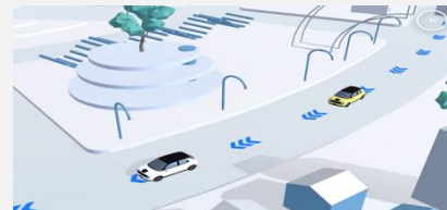
Honda e プロモーション AR