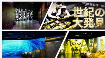
横浜ツタンカーメンミュージアム (総合映像演出)