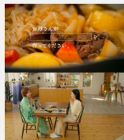
久原本家 | 「母の日、茅乃舎。」