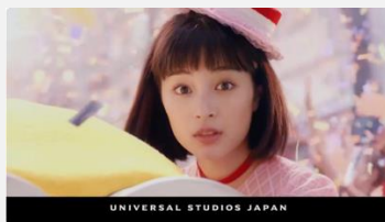
Universal Studio Japan