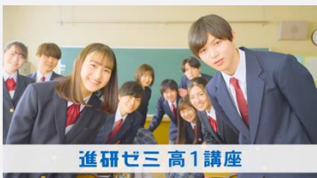
進研ゼミ | 高校講座