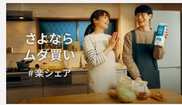
アイリスオーヤマ | STOCK EYE