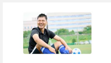
Google | 「自分だけの道があるから」