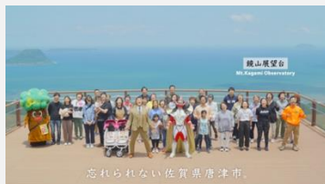
佐賀県唐津市×新日本プロレス | 「佐賀県唐津市のこと、もっと知って下さい。」