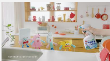
ジョンソン・エンド・ジョンソン | カピキラー