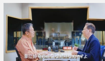
サントリー | オメガガイド