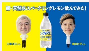
サントリー | 天然水SPARKLING 「レモンプロが飲んでみた」篇