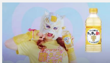
ミツカン | 「カンタン酢ターライト・キッド」