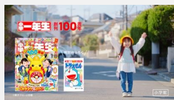
小学館 | 「小学一年生」創刊100周年特大号