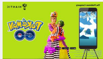
任天堂 | ポケモンGO