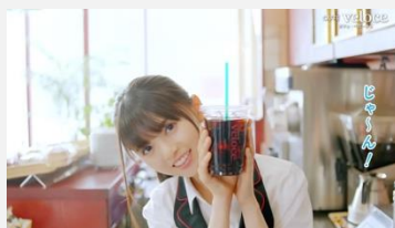
カフェ・ベローチェ | 「ベローチェでSUMMER」篇