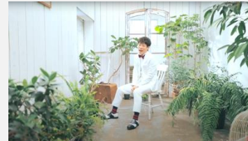
横山だいすけ | 「笑顔をあつめて」