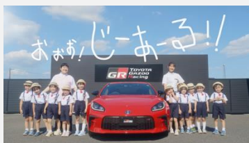
TOYOTA GAZOO Racing | 「おおお！じーある！」