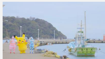
ポケモン Kids TV | 「エビカニクス」ケロボンズコラボ