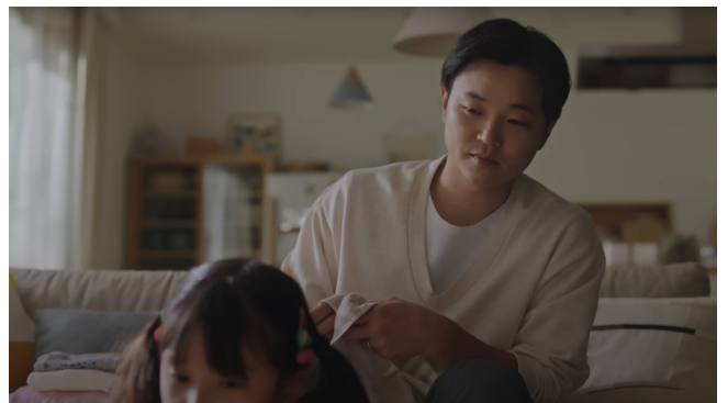
第一三共株式会社 サイエンス。それは、希望。TVCM「家族の日々」篇