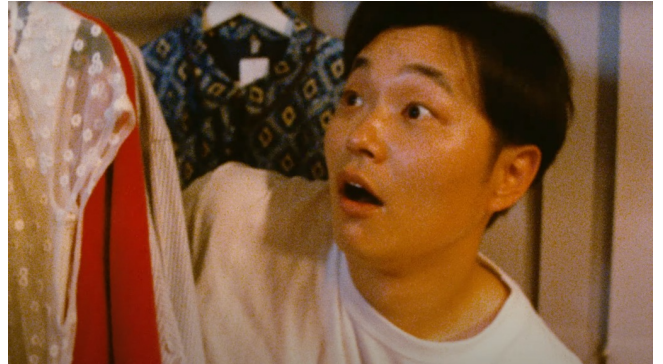
東京彼女 7月号「きっと、つなげる」